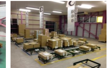
空調された製品倉庫