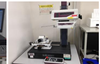
ミツトヨ 輪郭形状測定機