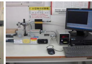
大阪精密工業 ギア嚙合い測定機