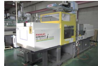
射出成形機 ファナック 100t